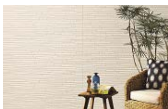
ルミナードロンテ PZ