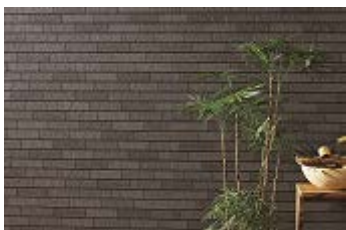
トランナーレタイル PZ