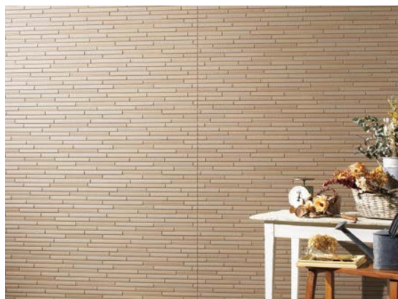
ガーディナル Smart AT-WALL15PZ シリーズ「アールボーダーPZ」の施工例（色：アルボベージュP）

今回発売する「ガーディナル Smart」は、従来の「ガーディナル」でご好評いただいているシーリングレス工法に、新たに“新四辺合じゃくり工法”を採用し、外壁をスッキリと美しく仕上げる新シリーズです。今回、板の長さを従来の6尺から10尺としたことにより、板途切れが少なく仕上げるのが可能となったほか、出隅部の納まりとして同質出隅を用いずに「出隅インナージョイナー」を用いた「インナー出隅工法」を新たにご用意しており、従来の同質出隅と比較し、本体と同質出隅との間の目地がない美しい仕上がりを実現します。