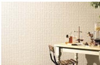
モザイクストーンロンテ PZ