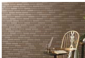
やまがた割肌タイル 16PZ