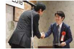
前回の 表彰式の様子 ▼