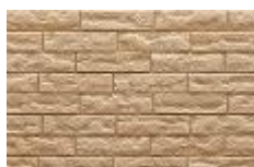
カラーレクリーム F