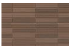
GR カーキ F