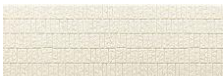
MS クリアホワイト F