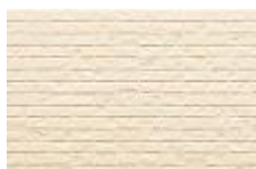
ナチュラルホワイト F