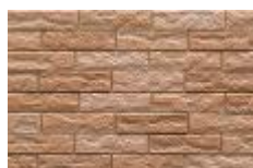
グストオレンジ F 新色