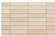
GR ホワイト F