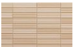
GR アイボリー F