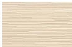
ナチュラルホワイト F