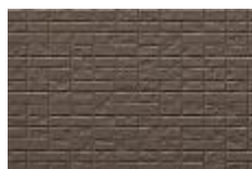
ディープチャコール F