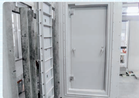
試験準備 (装置装着前)