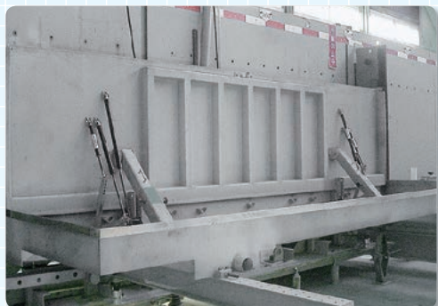
試験準備 (跳ね上げ状態)